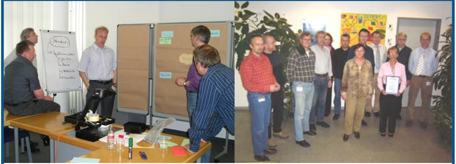
Links: Workshop im Level 2 für eine bessere Zusammenarbeit. Ein Punkt war die Erarbeitung von gemeinsamen Standards, einheitlichen Formularen, Vorlagen und Checklisten. Rechts: Stolz präsentieren die beteiligten Mitarbeiter die Auditorkunde.

gangsprüfung und Material Logistik ein effizientes Office Management unter Anwendung von KAIZEN-Methoden einzuführen.