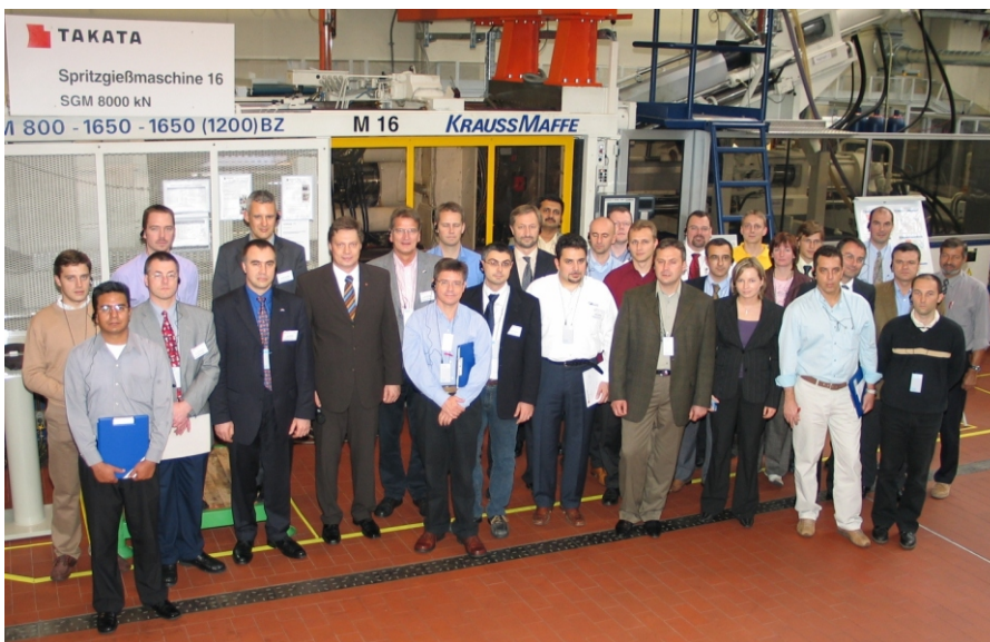
27 Teilnehmer aus 9 Ländern informierten sich über den erfolgreichen Einsatz von KAIZEN-Methoden bei den deutschen Niederlassungen von Weltklasse-Unternehmen.

und hat ihre eigenen TPM-Säulen entwickelt, welche sie den Besuchern vorstellte. Die Vorteile von 'One-Piece-Flow' durfte die Gruppe bei der Takata Petri AG hautnah erleben und die Umicore AG & Co. KG bot ein Beispiel dafür, wie der nachhaltige und konsequente Einsatz von KAIZEN-Methoden zu dauerhaftem Erfolg führt. Viele pfiffige Ideen gab es bei Rolls Royce Deutschland zu sehen. Dort konzentriert man sich momentan auf die Optimierung durch punktuelle Verbesserungen mit Kobetsu KAIZEN. Endstation der Tour war die KAIZEN Teaching AG in Bad Homburg, wo die neuesten Trends zum Thema 'KAIZEN im Office' vorgestellt wurden. ■